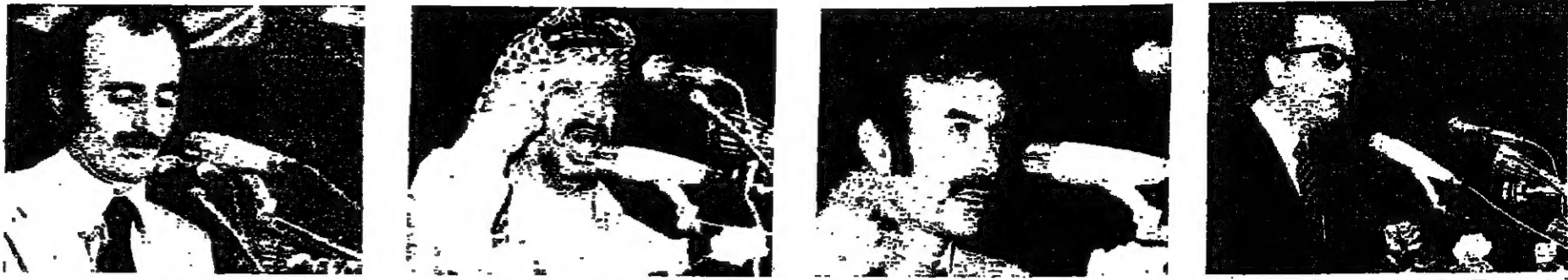
الوزير سلمان ■ ممثل سوريا السيد عبدالله الاحمد ■ السيد ياسر عرفات ■ السيد وليد جنبلاط ■